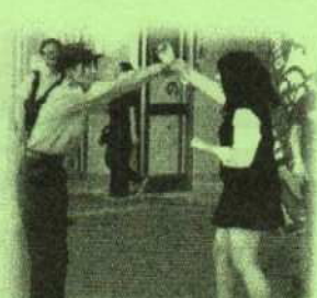
女性警察官による護身術訓練。