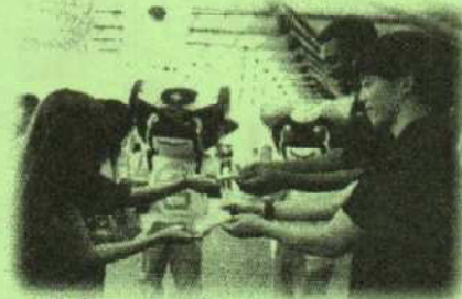
岐阜スүүプス選手「ヘルプミーカード」「ヘルプユーカード」を配布。

活動では、痴漢被害を声を出さずに助けを求めることができるSOSのヘルプカードを作成し配布、また護身術訓練も行いました。