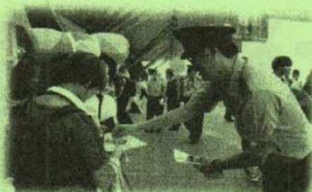
チラシや広報グッズを配布。