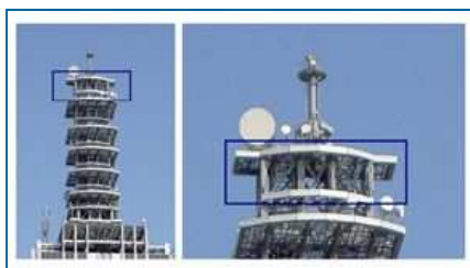
大ゾーン基地局の外観

大ゾーン基地局とは、通常の基地局より広い、半径約7キロ、360度全域のエリアをカバーする災害時専用の基地局のこと。広域災害や停電時に、人口密集地や官公庁がある重要拠点への通信を確保するために設置される。停電時でも停波しにくいよう対策が取られており、伝送路も損傷に備えて2ルートを確保するなど、信頼性を向上させた。普段は稼働せず、非常時のみ使用される。